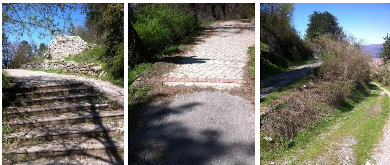
Fotografia 3 Pjesë e ngelur e kullës mesjetare