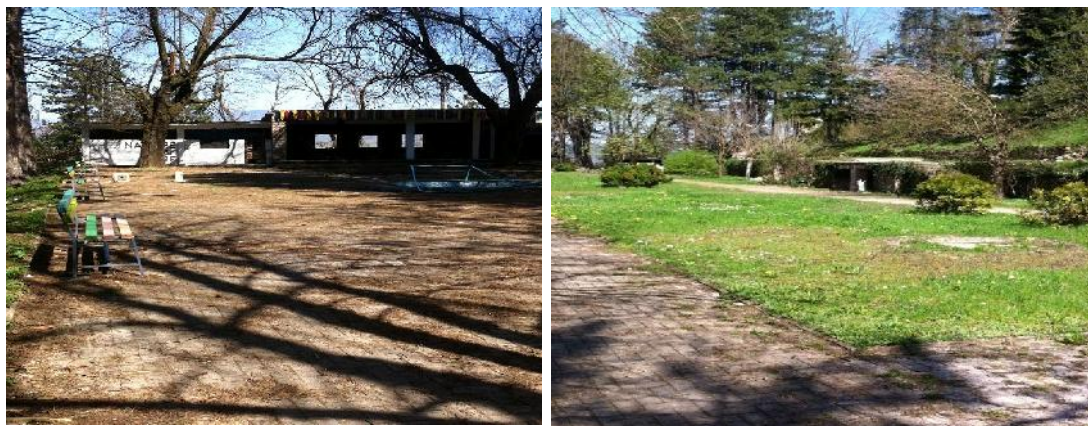
Fotografia 1 dhe fotografia 2 Gjendja aktuale e sipërfaqes para objektit