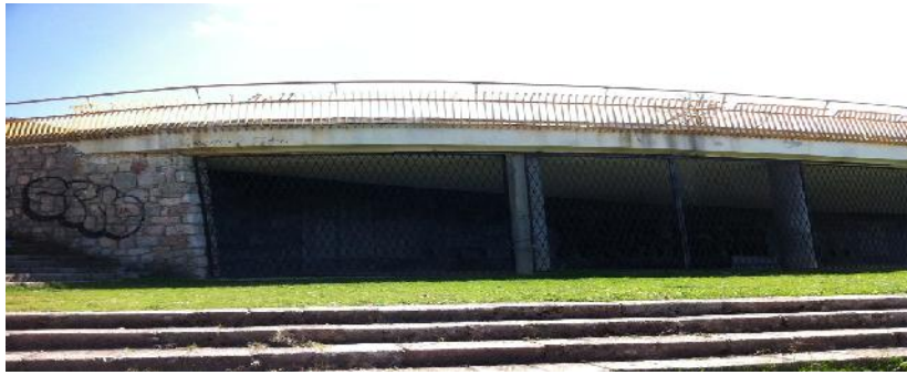
Fotografia 6 Përkujtimore – Kullë