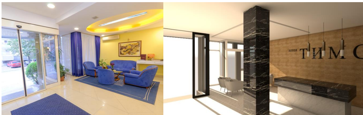
Лоби и рецепција –Гарнитура и столарија