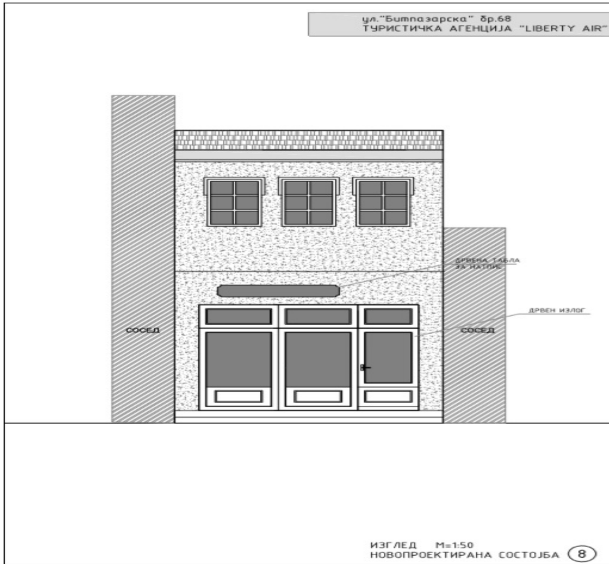
Слика 3 Скица на планирана состојба

Целта на Планот за управување со културно наследство е заштита, отстранување и намалување на негативните ефекти врз културно наследство во согласност со Законот за заштита на културно наследство на Република Македонија.