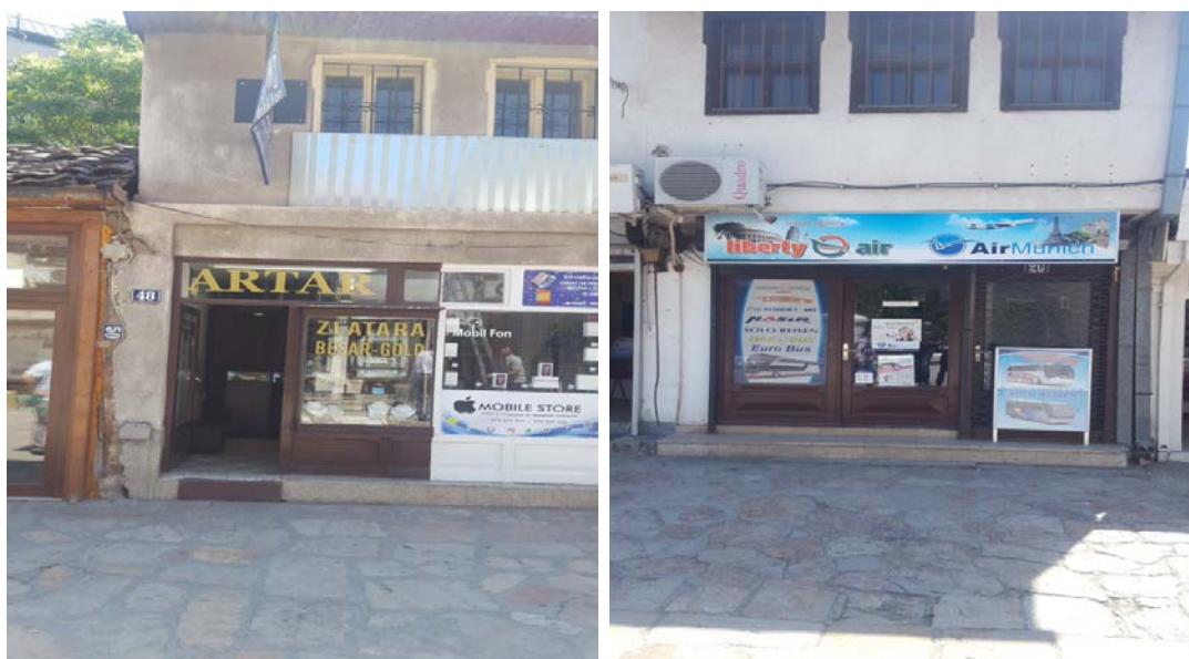
Слика 2 Сегашна состојба на дуќаните во Стара Чаршија

Поради бесправни ископи за различни видови на интервенции од корисниците на единечни објекти во чаршијата, партерот на уличните мрежи и другите отворени површини е во исклучителна деградирана состојба и поради овие причини Општина Чаир предвидува санација на истата. Исто така, проектот предвидува санација на постоечките витрини преку замена на прозори и врати и поставување на натписи на 75 дуќани во Стара Чаршија кои се застарени или со метални и ПВЦ профили и со тоа го нарушиле автентичниот лик на Стара Чаршија.